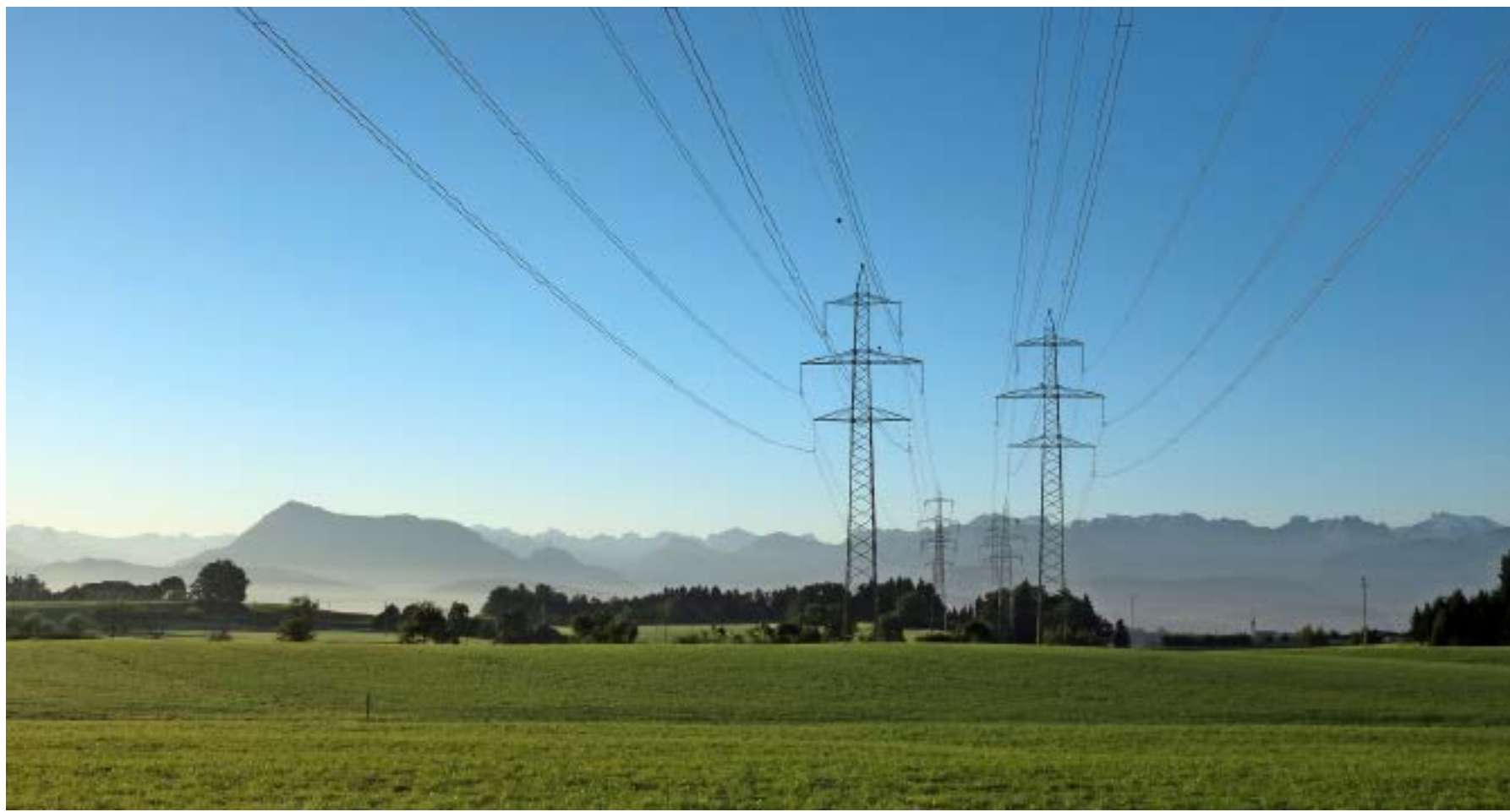
Digitalisierung und Automatisierung sollen die Stromnetze zukunftstauglich machen.

INTERNATIONAL Der Markt für Smart Grids steckt zwar erst in den Anfängen, wächst aber zweistellig. Anlegern eröffnen sich vielfältige Chancen.