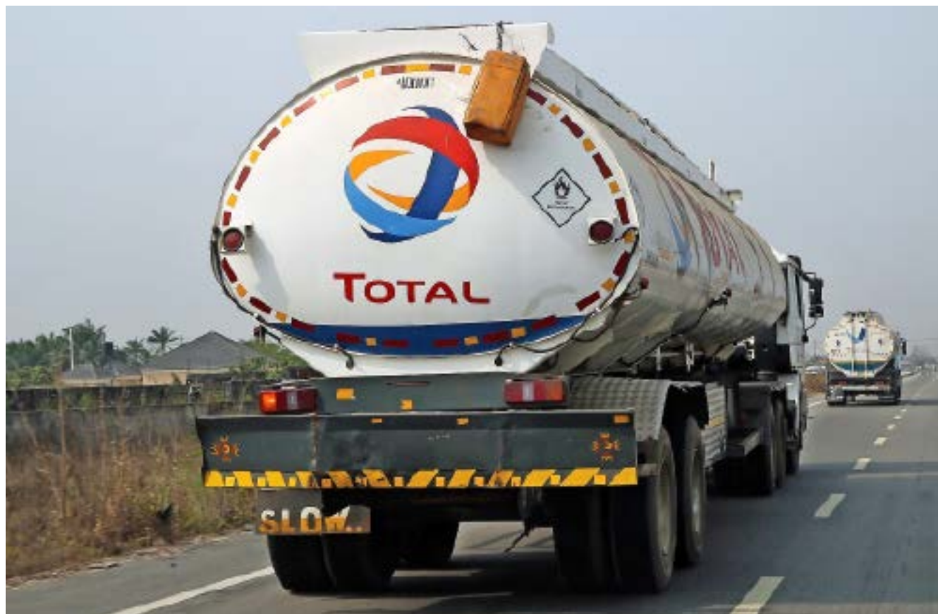
Total förderte im zweiten Quartal pro Tag 2,7 Mio. Fass Öläquivalente – ein Rekord und 9% mehr als in der gleichen Vorjahresperiode.

Anleger, die sich im Öl- und Gassektor engagieren wollen, haben die Qual der Wahl. Die Aktien der meisten Multis sind noch günstig bewertet und weisen sehr attraktive Dividendenrenditen auf (vgl. Tabelle). Favorit der «Finanz und Wirtschaft» ist Total. Die Franzosen waren die Ersten, die auf die Ausgabenbremse traten, sie waren die Ersten, die wieder zu investieren begannen und können nun die Früchte in Form einer rasch wachsenden Produktion ernten. Das lässt auf zukünftig höhere Gewinne hoffen und gibt Potenzial für Dividendenerhöhungen.