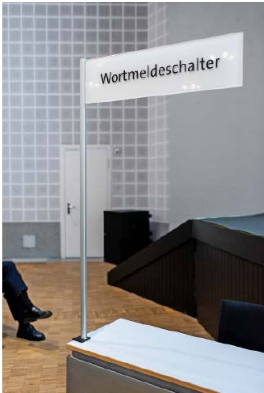
Auch in der EU sollen Aktionäre künftig zum Vergütungsbericht Stellung nehmen.

Institutionelle Anleger und Vermögensverwalter müssen gemäss SRD II neu offenlegen, wie sie abstimmen und ihre Mitwirkungsrechte wahrnehmen. Dabei gilt das Prinzip Comply or Explain. Volonté: «In der Schweiz sind bisher nur Vor-